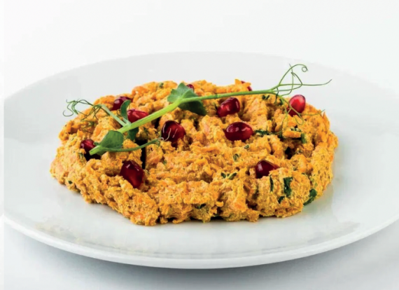
Фирменный пхали из моркови