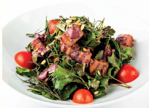
Салат морковный с имбирным соусом