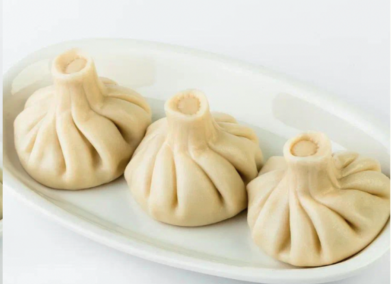
Хинкали с картофелем