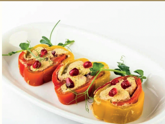
Болгарский перец с орехами