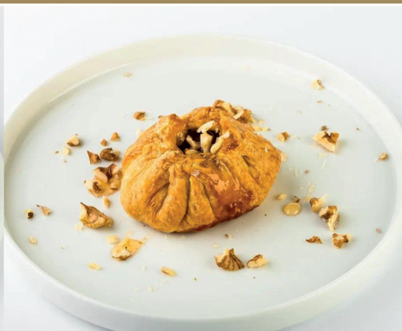
Яблочный пирог 120 г 290