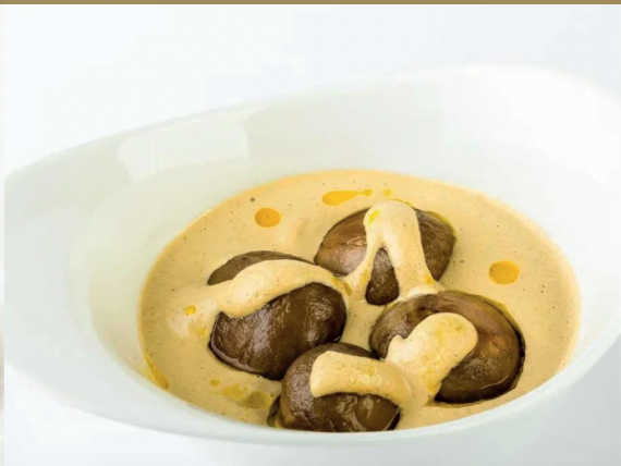
Сациви из грибов