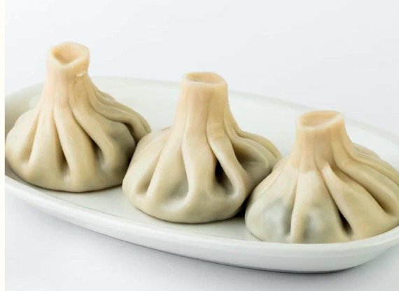
Хинкали с грибами