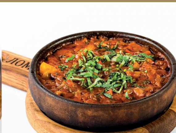
Чашушули из грибов