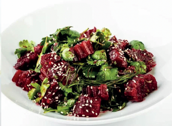
Салат из свёклы с ткемали