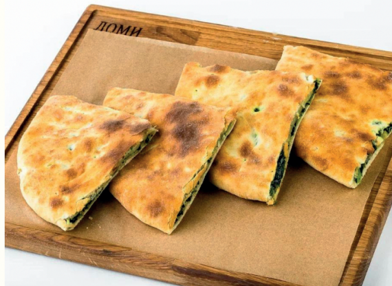
Хачапური со шпинатом