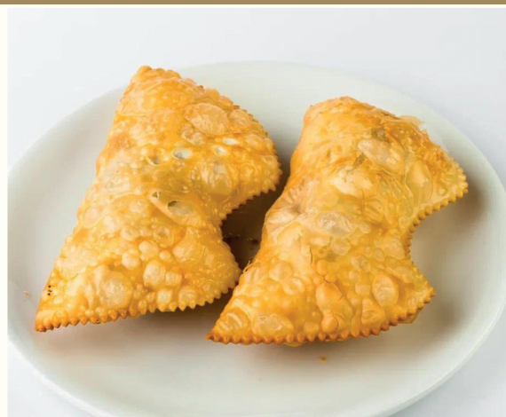
Чебурек с грибами 170 г 250