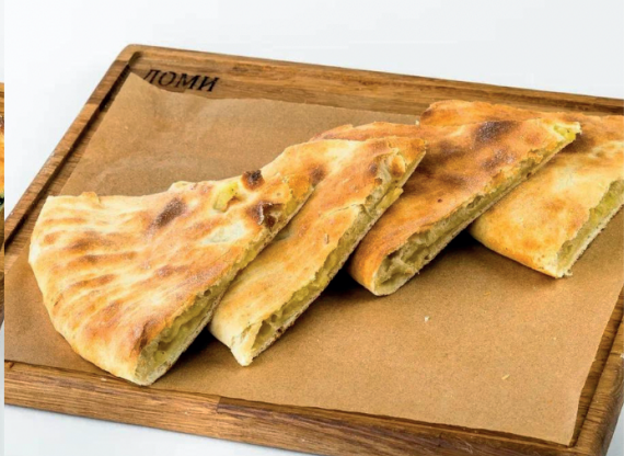
Хачапური с картофелем