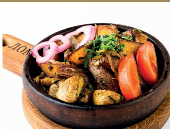
Жаркое из грибов с картофелем